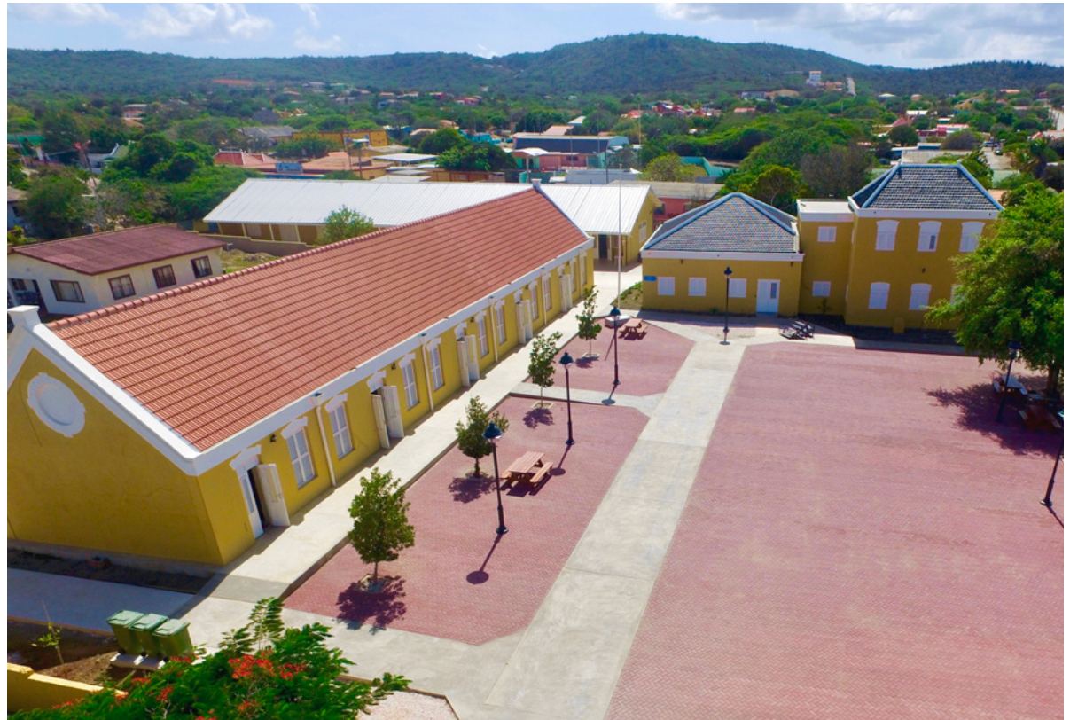
Cocari-complex Bonaire

Tot het erfgoed in Nederland behoren ook gebouwen, monumenten, plekken en objecten die te maken hebben met de joodse cultuur, religie en geschiedenis: van een kleine dorpsjoel of een vergeten begraafplaats tot bekendere plaatsen als het Spinozahuis en het Anne Frank Huis. Joodse begraafplaatsen zijn als rijksmonument beschermd, net als synagogen, de Hollandse Schouwburg en het Anne Frank Huis. Uw Kamer heeft het kabinet verzocht om bijzondere aandacht voor dit erfgoed. 8 Het kabinet erkent het belang van dit erfgoed, ook omdat deze plekken vaak verbonden zijn met een krachtige waarschuwing voor het heden en een boodschap voor de toekomst. Het kabinet ziet er op toe dat in de uitvoering van verschillende regelingen aandacht aan het Joods erfgoed wordt besteed.