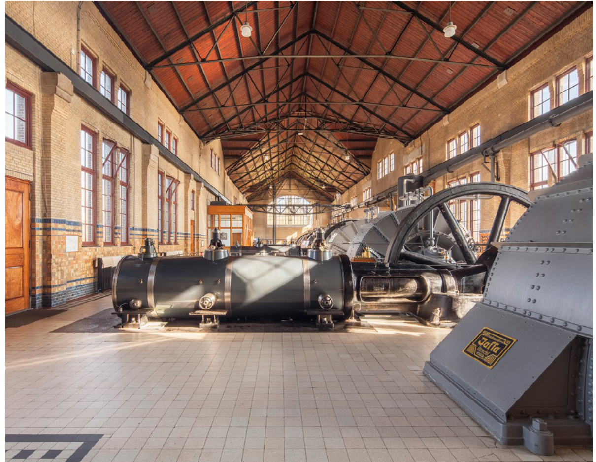
Ir. D.F. Woudagemaal • foto: Wouter van der Sar, Rijksdienst voor het Cultureel Erfgoed

Het kabinet heeft niet alleen oog voor de waarde van erfgoed, het investeert er ook flink in: de komende jaren is er € 325 miljoen extra beschikbaar. In de brief Cultuur in een open samenleving heeft het kabinet de plannen uit het regeerakkoord uitgewerkt. 1 De nu voorliggende brief gaat specifiek in op het erfgoedbeleid. De nadruk ligt hierbij op instandhouding en herbestemming, de leefomgeving en de verbindende kracht van erfgoed.