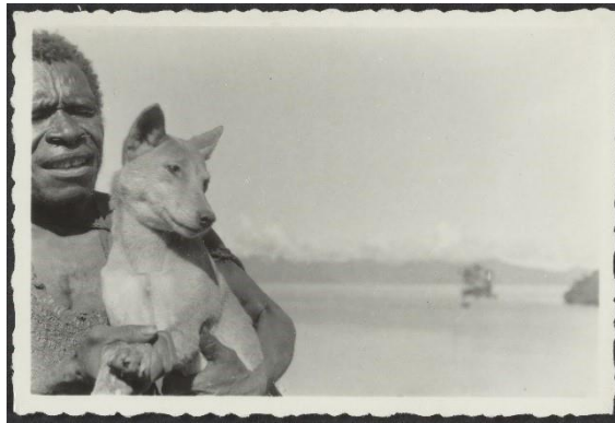
Expeditie KNAG naar Nieuw-Guinea, 1959 (archief KNAG, toegang 74, inv. nr. 191)

De hoofdactiviteit van dit project betreft het op deze vernieuwende wijze presenteren en aanbieden van dit koloniale erfgoed met betrekking tot een expeditie van het KNAG naar Nieuw-Guinea als lesmateriaal voor de onderbouw van het voortgezet onderwijs in het vak aardrijkskunde en mogelijk andere relevante vakken binnen de leergebieden mens & maatschappij en burgerschap en voor educatief gebruik bij Het Utrechts Archief. Dit educatief materiaal voor HUA willen we ook laagdrempelig aanbieden op het nog te lanceren platform Ons Land om het met een breder publiek te delen.