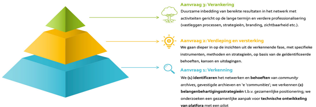
Figuur 1. Gefaseerde aanpak: opbouw van projectaanvragen

Een lerend netwerk, waar gemeenschapsarchieven en gevestigde instellingen van elkaar leren en kunnen samenwerken, vraagt om een gefaseerde aanpak. De opbouw van het netwerk staat met een doordachte missie, visie en verkenning van het netwerk zelf. Deze aanvraag staat aan de basis van een fundament voor een duurzaam verankerd lerend netwerk. Om dit fundament te leggen, verkennen we de stakeholders en actoren, (technische) mogelijkheden en strategieën ter bevordering van belangenbehartiging en professionalisering. Figuur 1 geeft de gefaseerde aanvraag weer.