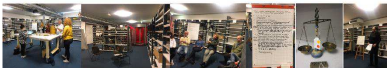
Zaalproject Sted Museum Schiedam "Uit het depot: werk in uitvoering" (2018)

Zelf ben ik al heel wat jaren op verschillende manieren betrokken bij museale waarderingsprocessen en OdMW. Na het bijwonen van de Museumkennisdag in oktober 2018, waar het thema diversiteit en inclusiviteit hoog op de agenda stond, kwam het thema 'participatie' helder op mijn netvlies te staan. Ik begon mij af te vragen hoe democratisch en participatief het er in museale waarderingsprocessen aan toe gaat, sinds het verschijnen van bovengenoemde publicatie in 2013. Tijd voor een verkenning.