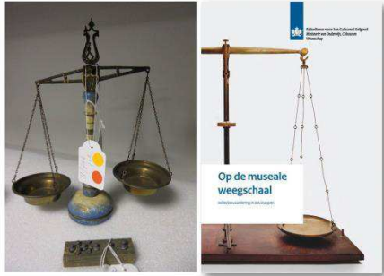
(afb 1) Balans opmaken, Op de Museale Weegschaal . Collectiewaardering in zes stappen , Rijksdienst voor het Cultureel Erfgoed (2013).