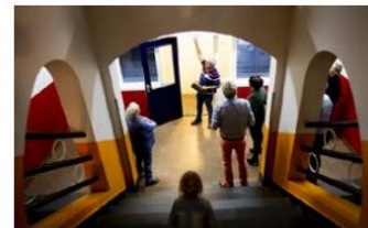
Lokale erfgoedorganisaties brengen als Erfgoedplatform Apeldoorn ieder jaar samen een beleidsplan uit met activiteiten en bepalen zo zelf waar het budget naartoe gaat.