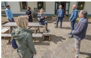
De gemeente Westerveld gaat samen met de inwoners en Wageningen Universiteit onderzoek doen naar ruimtelijke opgaven en behoud van eigenheid in een living lab.