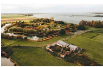
Erfgoedlab Brabant verstrekt tegoedbonnen waarmee burgers zelf diensten of producten kunnen inkopen om de mogelijkheden van herbestemming van een monument te verkennen. Fort Sabina kon hierdoor de herbestemming van de vaartuigenloods een stap dichterbij brengen.

“Democratische vernieuwing kan ook op landelijk niveau. Organiseer bijvoorbeeld een burgerberaad over belangrijke erfgoedkwesties.” Martine van Lier, Federatie Instandhouding Monumenten