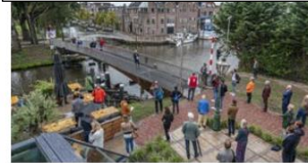
Al sinds 2012 zetten Leidenaren zich in voor de realisatie en het onderhoud van een aaneengesloten, zes kilometer lang stadspark op de oude vestingwallen.