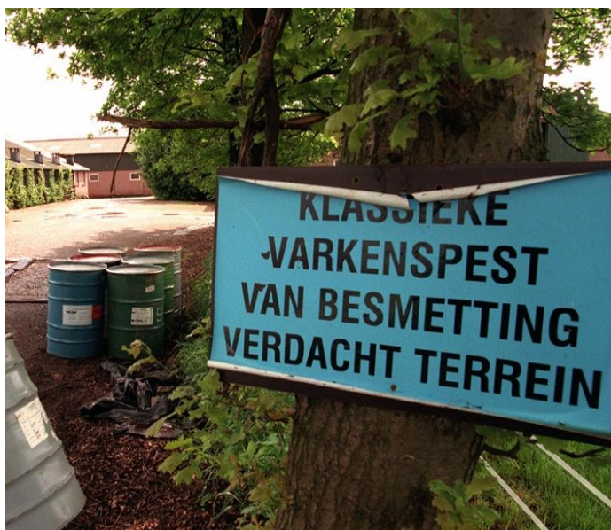
Foto 6. Het blauwe bord dat aangaf welk bedrijf met varkenspest was besmet of daarvan verdacht werd.

"Maar als er steeds meer gevallen zijn, denk je op een gegeven moment, toe maar want ge komt toch unne keer aan de beurt." Jos gaat verder: "Er was een vervoersverbod, maar elke dag werden er nieuwe biggen geboren terwijl de grotere biggen niet vervoerd konden worden. Toen hebben we de deuren van de hokken maar opengezet en liepen de biggen in de gang. Later ook in een lege kippenstal die we zowel op de Bovenstehuis als op de Zijp hadden. De biggen lagen daar in het stro in een diep gat. Toen het nog een kippenstal was, lag daar de kippenmest. De biggen werden natuurlijk groter en het werd steeds meer werk om het stro voortdurend te verversen. Omdat er ook voor mest een vervoersverbod was, hebben we een tijdelijke opslag buiten moeten maken. De pest kwam in golven, net als nu met corona." Wilma zegt: "In zo'n boerendorp als Boekel had iedereen wel familie die geraakt was door de pest. Je weet dat het komt, maar niet wanneer. Je leeft steeds in spanning."