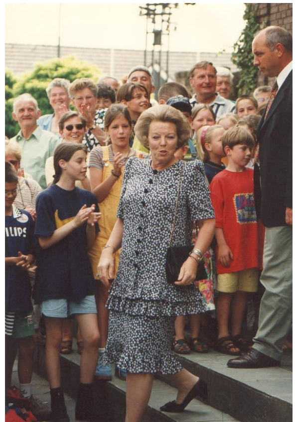
Foto 3. Koningin Beatrix op werkbezoek in het varkenspestgebied op 9 juni 1997. Op de foto verlaat ze het Boekelse gemeentehuis, op weg naar het crisiscentrum in het Sint-Jangebouw.

Het tweede geval was een klant van de Heikant. Frans zegt: "Er was al eerder iets aan de hand met de varkens daar, maar de symptomen waren sober. Het was niet simpel om varkenspest vast te stellen. Zo'n virus sluipt erin, komt binnen in een hoekje van het bedrijf en hoe ziek dieren worden hangt af van hun kwetsbaarheid. Bij jonge biggen valt de ziekte sneller op, maar bij vleesvarkens zagen we vooral griepachtige symptomen."