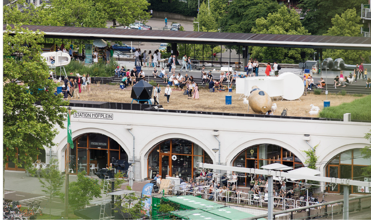
De Hofbogen in Rotterdam zijn met een mix van functies een voorbeeld van een gezond gelaagd deel van de stad.

In de ruimtelijke ordening en gezondheidszorg wordt al gewerkt met het concept de Gezonde Stad. Daarbij is ook erfgoed van belang. "Uit onderzoek van de WHO blijkt dat in contact staan met het verleden bijdraagt aan een gezonder leven." Een van Soeterbroeks gesprekpartners, Cor Wagenaar van het kenniscentrum Architectuur, Stedenbouw en Gezondheid van de Universiteit van Groningen, formuleerde het zo: "Een stad die de sporen draagt van verschillende bouwperiodes, een 'leuk rommeltje' waar we een mix van functies zien, is een gezonde stad." Een voorbeeld van