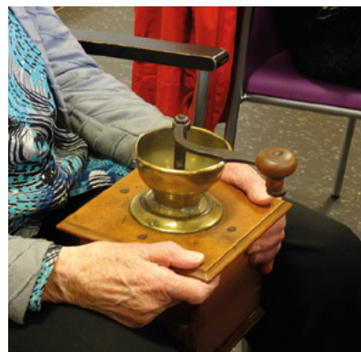
Feest van Herkenning is een project voor mensen met dementie. Met gebruik van erfgoed halen ze herinneringen op.

in goede banen geleid door vanuit verschillende perspectieven een gezamenlijke basis te zoeken. “Erfgoedorganisaties moeten niet weglomen voor discussies als Black Lives Matter. Ik ben onderhandelaar geweest en weet dat je niet op zoek moet naar het compromis, maar naar een alternatief verhaal waarin beide partijen zich herkennen.”