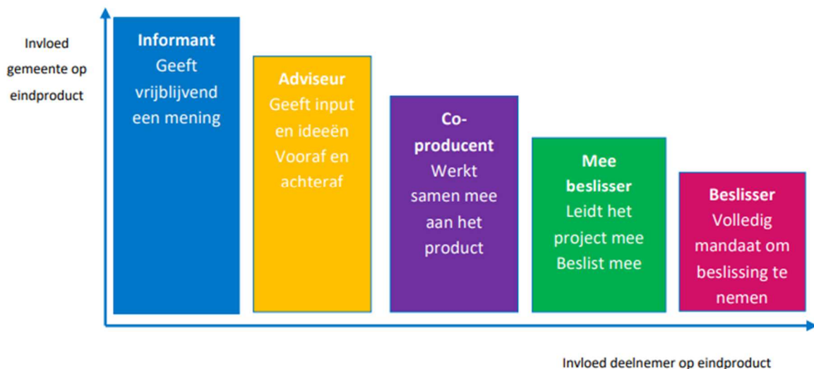
Figuur 3: Participatietrap gemeente Delft (Gemeente Delft, 2022)

Zo hebben de gemeente Delft en Bergen een soortgelijk beeld op de mate van invloed van participanten. De gemeente Delft geeft de mate van invloed aan door middel van de 'participatietrap' en de gemeente Bergen met een 'participatieladder'.