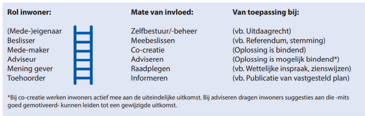
Figuur 4: Participatieladder gemeente Bergen (Gemeente Bergen, 2020)

Uit deze modellen vallen ongeveer dezelfde participatieniveaus te lezen. Ze beginnen elk bij een rol van toehoorder of 'mening gever', waarbij op het model van de gemeente Delft duidelijk wordt gemaakt dat de gemeente uiteindelijk de meeste invloed zal hebben op het eindproduct bij deze niveaus van participatie. De niveaus lopen door van adviseur naar co-producent naar mede-eigenaar of beslisser. Wat bij de modellen van de gemeente Delft en Bergen specifiek opvalt is dat toehoren en een mening geven als participatie wordt gezien. De gemeente Amsterdam heeft een zelfde blik op participatieniveaus, in haar Leidraad burgerparticipatie wordt specifiek aangegeven dat informeren de meest minimale vorm van participatie is (Gemeente Amsterdam, 2021).