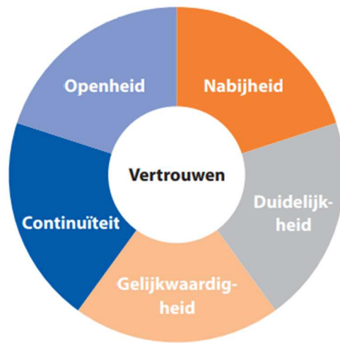
Figuur 2: Waarden participatie gemeente Bergen (Gemeente Bergen, 2020)

De vijf kernwaarden voor participatie in Bergen zijn ingegeven door de bestuurlijke overtuiging dat het belangrijk is om het vertrouwen tussen burger en overheid te vergroten. Deze bestuurlijke wil wordt verwerkt in het participatiebeleid. De gemeente Hof van Twente en Delft stellen op een andere manier uitgangspunten op voor participatie, en rekenen dat niet toe aan een kernwaarde die zij aan willen houden. Zij richten zich voornamelijk op het creëren van een zorgvuldig participatietraject. De gemeente Hof van Twente stelt vier uitgangspunten op (Gemeente Hof van Twente, 2022):