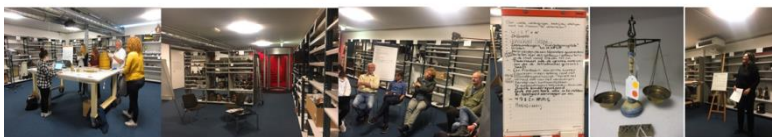
Zaalproject Sted Museum Schiedam "Uit het depot: werk in uitvoering" (2018)

Zelf ben ik al heel wat jaren op verschillende manieren betrokken bij museale waarderingsprocessen en Odmw. Na het bijwonen van de Museumkennisdag in oktober 2018, waar het thema diversiteit en inclusiviteit hoog op de agenda stond, kwam het thema ‘participatie’ helder op mijn netvlies te staan. Ik begon mij af te vragen hoe democratisch en participatief het er in museale waarderingsprocessen aan toe gaat, sinds het verschijnen van bovengenoemde publicatie in 2013. Tijd voor een verkenning.