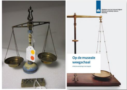
(afb 1) Balans opmaken, Op de Museale Weegschaal . Collectiewaardering in zes stappen , Rijksdienst voor het Cultureel Erfgoed (2013).