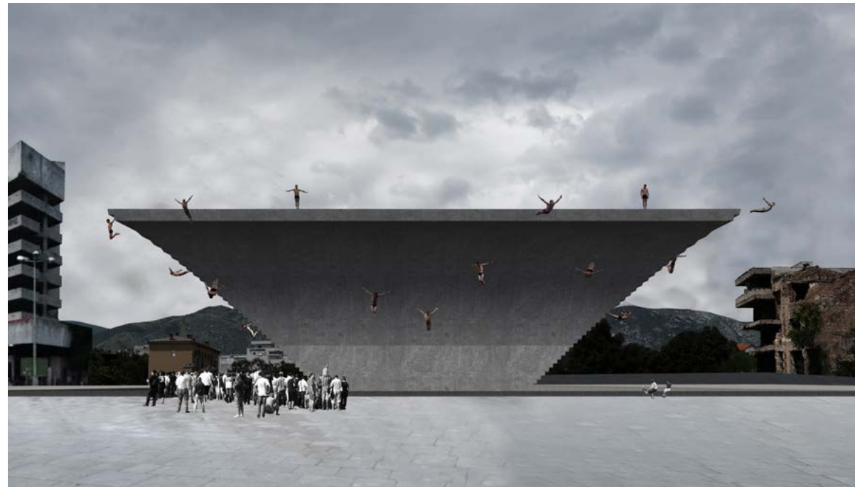
Ontwerpvoorstel 'Jump' door architect Arna Mackic, studio L.A. www.studio-la.org

Voor deze cultuuragenda zoekt het kabinet goede samenwerking met de andere overheden. De verschillende overheden versterken elkaar. Met het culturele veld is het kabinet van mening dat 'een combinatie van een sterke landelijke regie en een op de praktijk gerichte benadering' de beste voorwaarden schept voor een bloeiend cultureel klimaat. 34 Het kabinet roept de andere overheden op het voorbeeld van het kabinet te volgen en ook in cultuur te investeren.