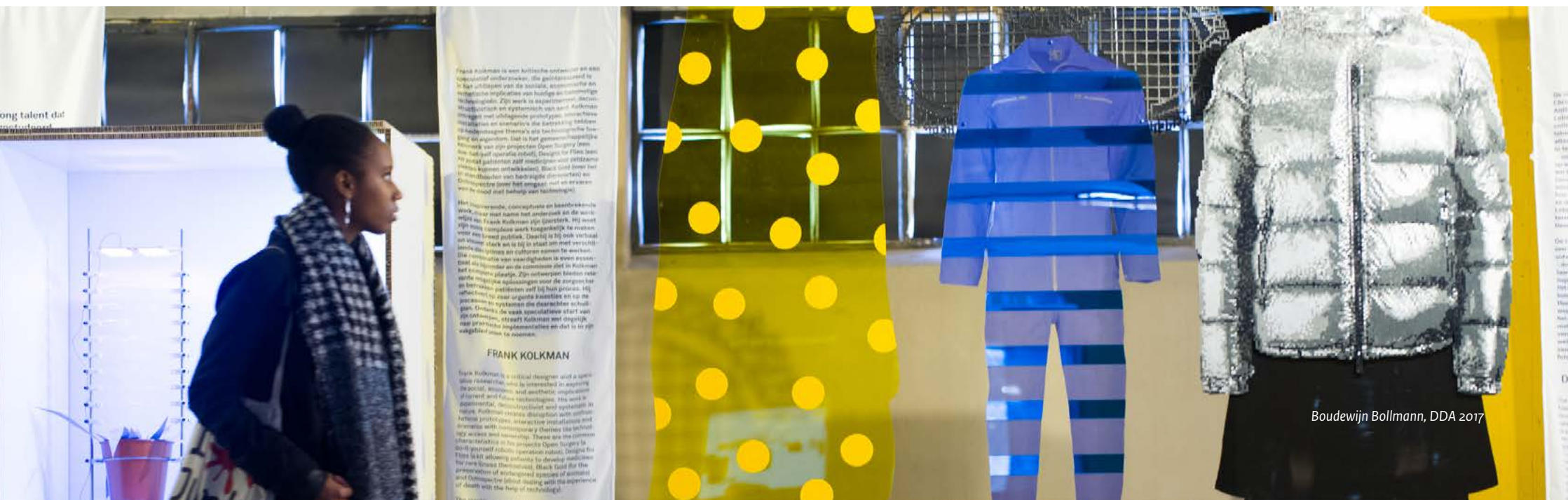
Boudewijn Bollmann, DDA 2017

Investerings vanaf 2019 en 2020 zullen in de desbetreffende rijksbegrotingen worden opgenomen.